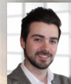
MODERA: D. David Marsal Sàbat Desarrollo de Negocio Industria y Logística SIGNIFY